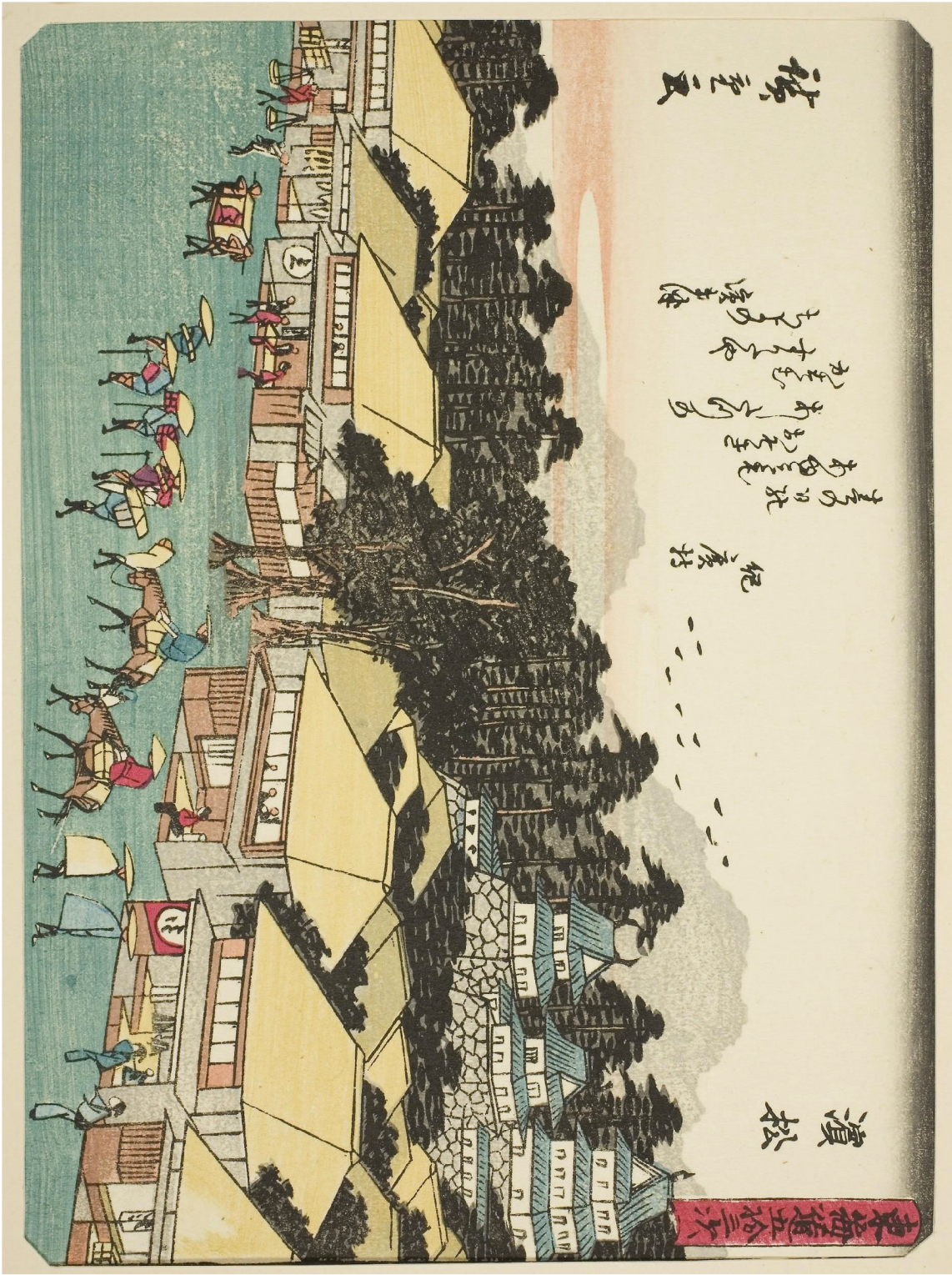
Título: Hamamatsu, de la serie “Cincuenta y tres estaciones del Tokaido ( Tokaido gojusan tsugi )”, también conocido como Tokaido con poema ( Kyōka iri Tokaido ) Artista: Utagawa Hiroshige (Japón, 1797–1858)