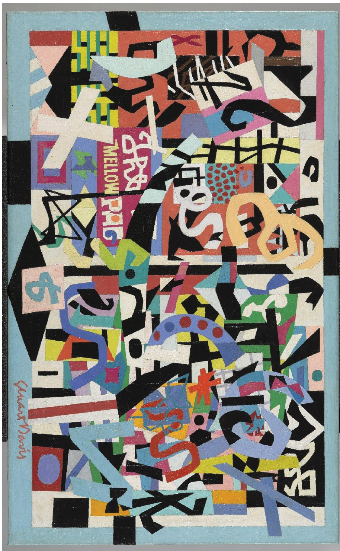
Título: El Mellow Pad Artista: Stuart Davis (Estados Unidos, 1892-1964)