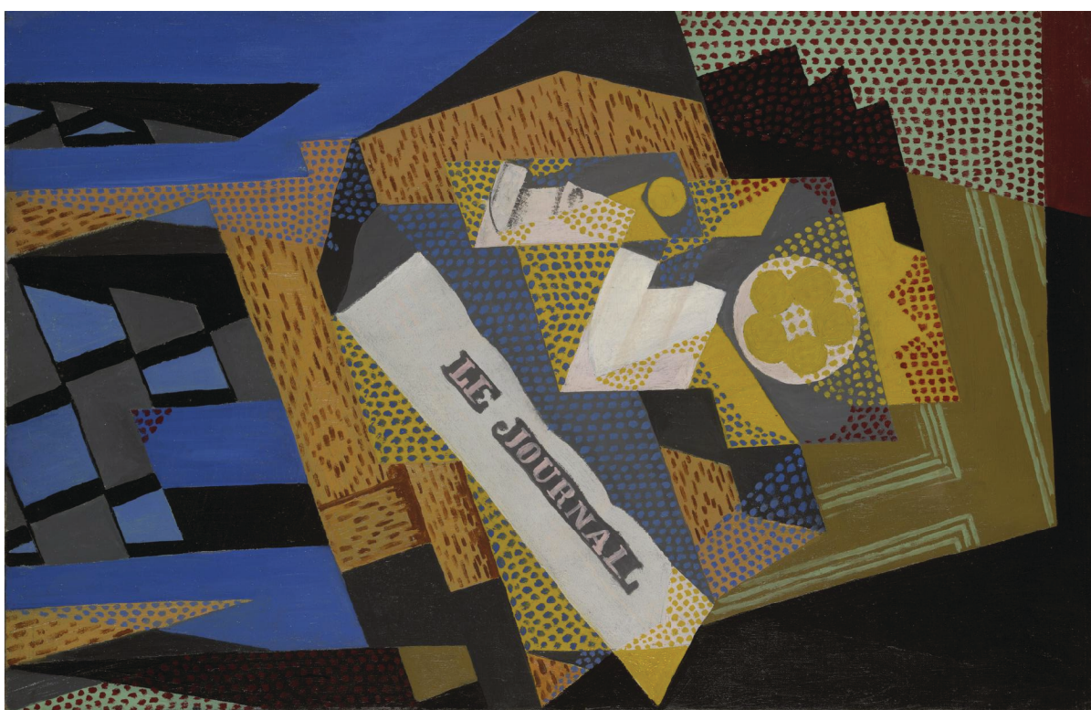
Título: Periódico y plato de frutas Artista: Juan Gris (España, 1887–1927)