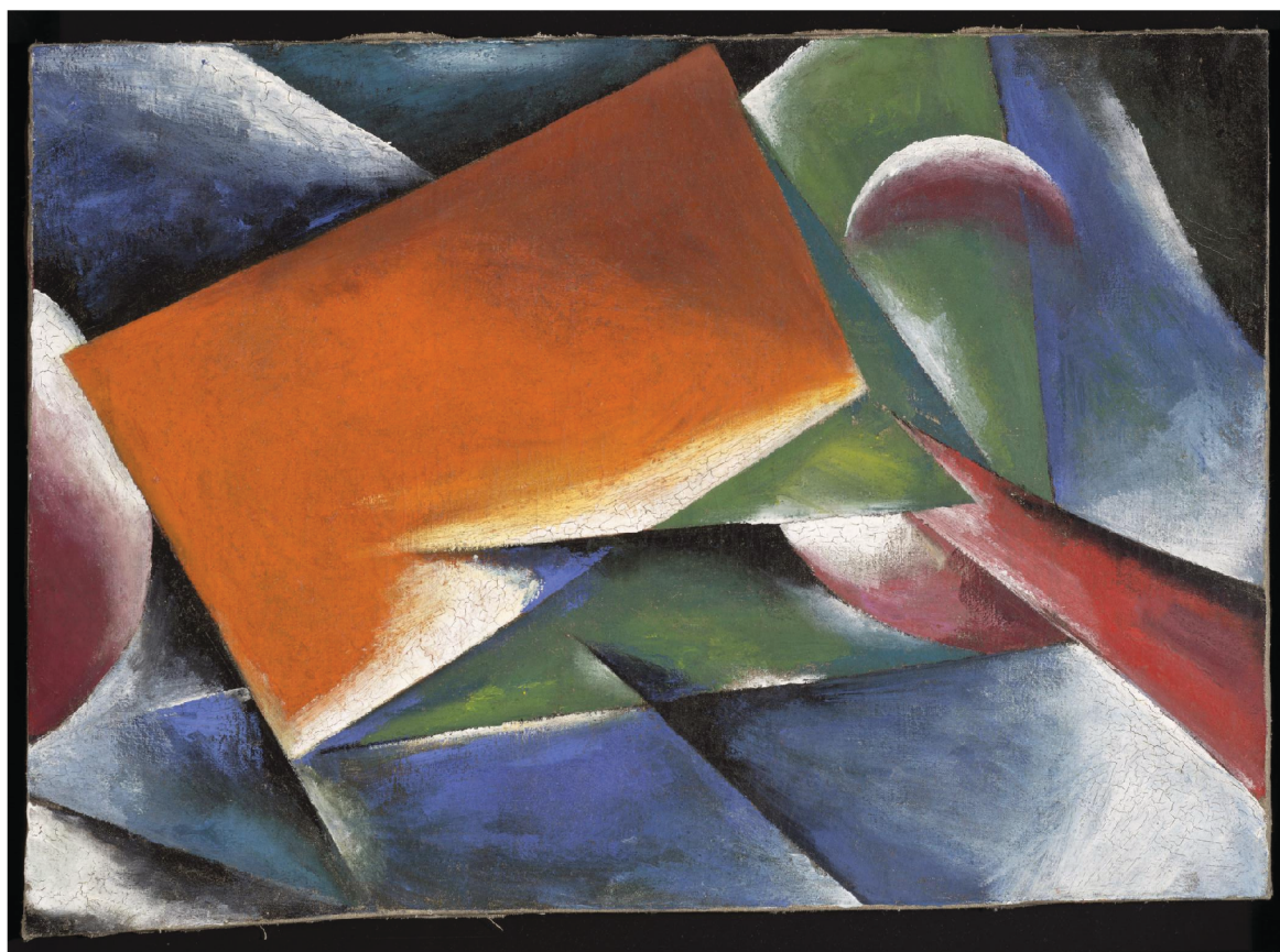
Título: Arquitectura pictórica Artista: Liubov Popova (Rusia, 1889–1924)