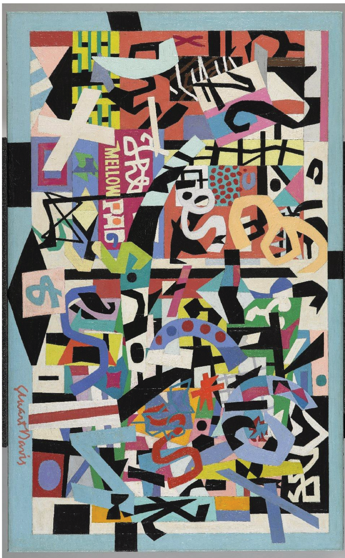
Título: El Mellow Pad Artista: Stuart Davis (Estados Unidos, 1892-1964)