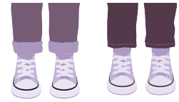
Longitudes de zapatos de cuarto grado

Los estudiantes de una clase de cuarto grado recolectan datos sobre sus tallas de zapato y sus longitudes. Grafican las longitudes de los zapatos en un diagrama de puntos.