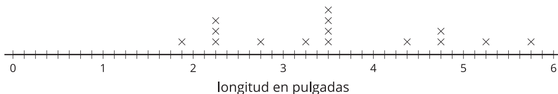
Datos de los lápices de colores

Como las fracciones tienen denominadores diferentes, usamos fracciones equivalentes para graficarlas. Luego, usamos diagramas de puntos y lo que sabemos sobre la suma y la resta de fracciones para resolver problemas sobre los datos.